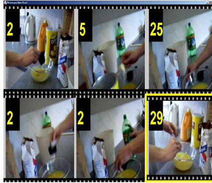
ภาพการบันทึกขั้นตอนการทำอาหาร