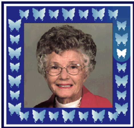
รูปครอบครัวแบบดิจิทัล

กลุ่มของผู้สูงอายุจำนวนหนึ่งได้มาเยี่ยมชมและทดลองใช้เครื่องต้นแบบของระบบนี้ โดยทั่วไปแล้วพวกเขาพอใจกับการทำงานของระบบ และไม่คิดค้านกับการที่พวกเขาถูกเฝ้าสังเกตโดยสมาชิกในครอบครัว